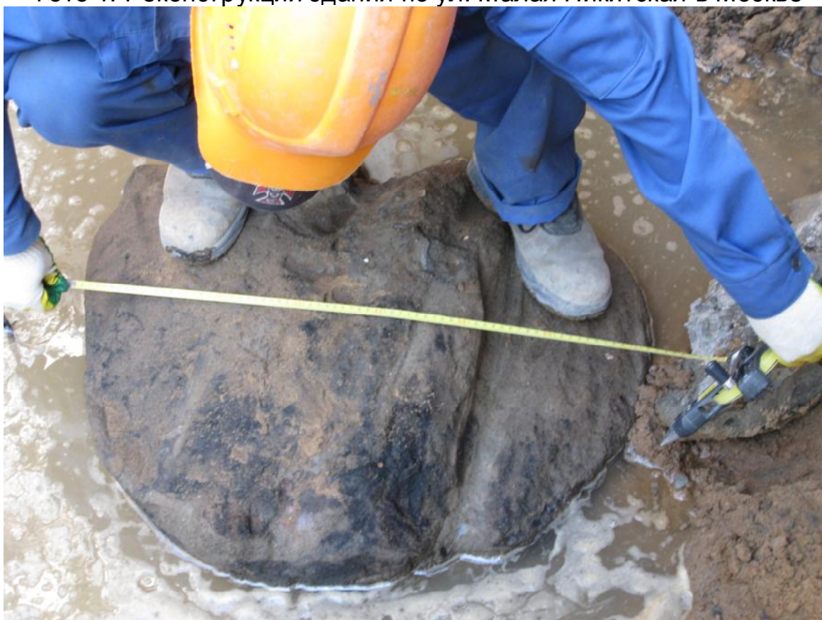
Фото 2. Грунтоцементная свая