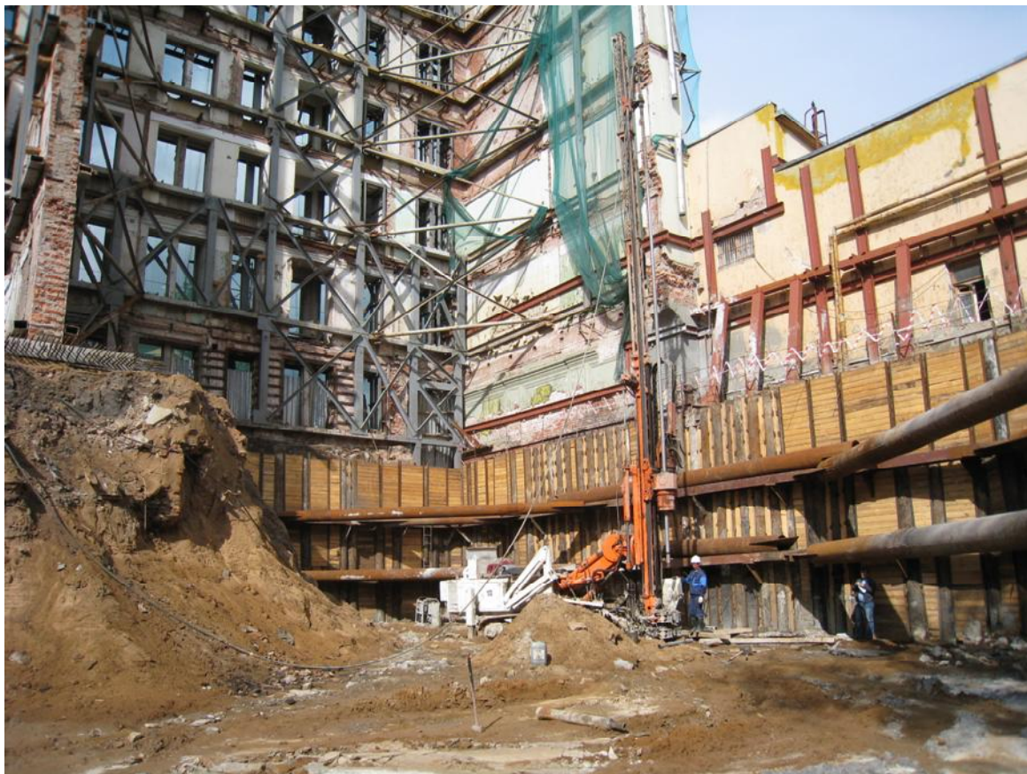
Фото 1. Реконструкция здания по ул. Малая Никитская в Москве